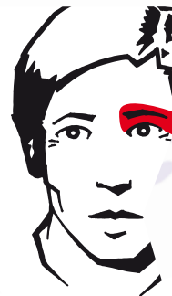
Localisation typique de l'algie vasculaire de la face

L'algie vasculaire de la face est une forme de céphalée primaire heureusement fort rare. Cette céphalée touche plus les hommes que les femmes. Elle se traduit par une douleur abominable qui survient par "grappes", ou "clusters" en anglais, d'où l'appellation "cluster headache". Il s'agit d'une douleur lancinante et perforante qui siège à l'arrière d'un œil.