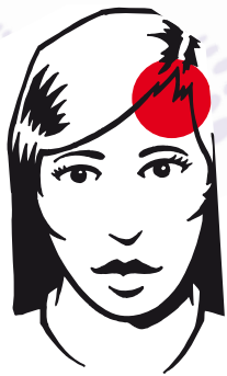
Localisation typique de la migraine

La migraine est aussi une forme de céphalée primaire. Les femmes souffrent trois fois plus de migraine que les hommes. La douleur est généralement et typiquement située d'un seul côté de la tête, dans la région frontale.