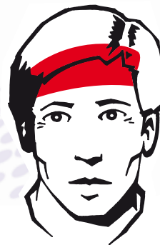
Localisation typique de la céphalée de tension

La céphalée de tension est la forme la plus fréquente de céphalée . Les hommes et les femmes sont pareillement touchés. La douleur siège le plus souvent des deux côtés de la tête (souvent dans la région frontale). Elle donne l'impression d'avoir le crâne serré dans un étau.